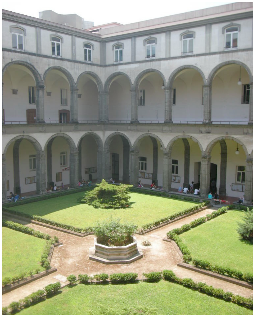
Università Federico II, Dipartimento Studi Umanistici, Napoli

Accademia Pontaniana, V. Mezzocannone 8, Napoli