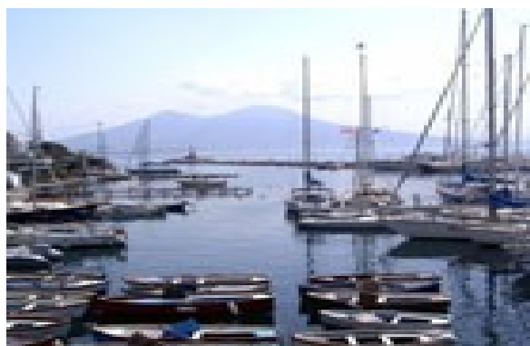
Borgo marinari di santa Lucia

Transatlantico nasce sul mare di Napoli ai piedi di Castel dell'Ovo. Si trova all'interno del magnifico borgo marinari di Santa Lucia che è una piccola Napoli nascosta dentro il capoluogo campano: come una minuscola cittadina costiera agganciata alla metropoli, un mondo a parte tutto da scoprire anche per gli stessi napoletani. Il Transatlantico gode di una posizione privilegiata anche per quanto riguarda i collegamenti: siamo a metà strada tra porto e stazione, a pochi passi da piazza del Plebiscito.