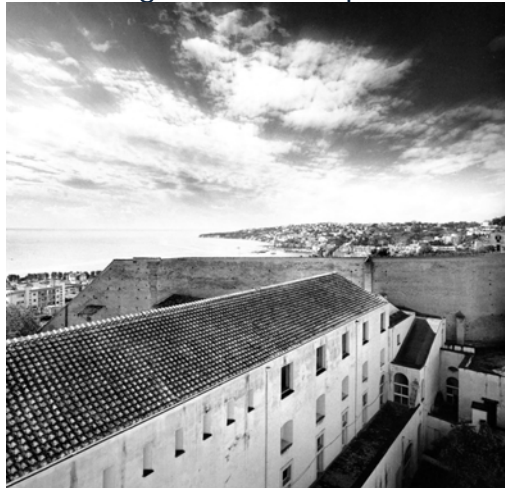
Università Suor Orsola Benincasa, View. Shot by Mimmo Iodice, in Le savoir sur la falaise

(Università degli Studi di Napoli Parthenope)